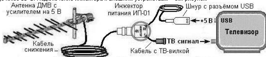
Рисунок - Схема подключения к внешним устройствам

предназначен для подачи питания +5 В на антенный усилитель по кабелю снижения антенны от современного телевизора через порт USB. Рассчитан для работы в интервале температур от плюс 10 до плюс 35°С. Подключение инжектора к внешним устройствам – см. рисунок.